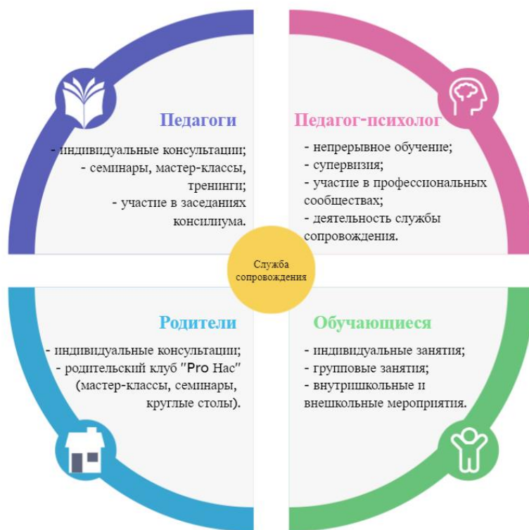
Рис.1. Схема системы психолого-педагогического сопровождения участников образовательного процесса в ГБОУ прогимназия «Радуга» №624.